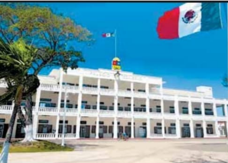
Gobierno del Estado de Quintana Roo