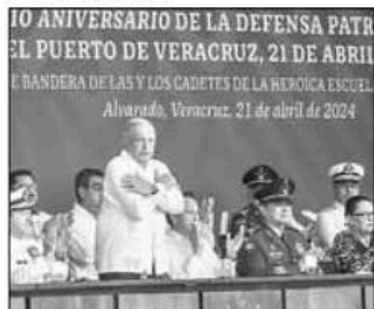
▲ López Obrador encabezó la ceremonia del 110 aniversario de la defensa del puerto de Veracruz.