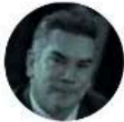
ALEJANDRO MORENO CÁRDENAS