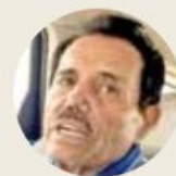
● El Mayo Zambada

ellos no lo detuvieron. Sería entonces la detención ilegal de un mexicano entregado a un gobierno extranjero que lo procesa sin reparar en el antecedente. No es tan complicado: un ciudadano mexicano pide apoyo a su gobierno ante lo que todo indica fue una flagrante ilegalidad. En ésta, justo ahora, El Mayo tiene razón.