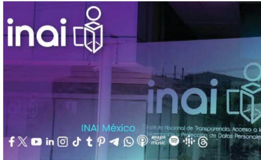
EL INAI se creó el 11 de junio de 2012 bajo el nombre de Ifai y a partir de junio de 2014 cambió al nombre que tiene actualmente. Su función es garantizar el derecho de los mexicanos a la información pública y la protección de sus datos personales. El órgano tiene autonomía de los 3 Poderes del Estado: Legislativo, Ejecutivo y Judicial, para evitar que se limite su actuación.

ron creados "para proteger a particulares y afectar el interés público", por lo que aseguró que es importante eliminarlos, para generar ahorros en la Administración Pública Federal.