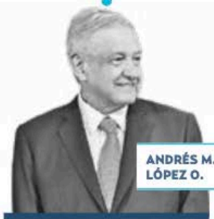
ANDRÉS M. LÓPEZ O.

► Próximo a salir estará el nuevo libro del presidente Andrés Manuel López Obrador , pues en su gira por Zacatecas, adelantó que en la primera quincena de febrero se publicará su próxima obra, en donde deja un testimonio de lo que ha sido la lucha, incluyendo su mandato presidencial. Dijo que se trata de toda una experiencia "dedicada a los jóvenes, para que conozcan los procesos democráticos en beneficio del pueblo".