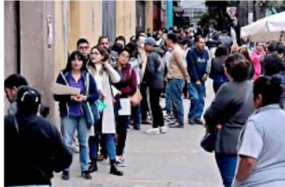
■ A las 13:30 horas en Fray Servando aún esperaban 50 personas en la fila para tramitar su credencial de elector.

Por su parte, el INE informó que tiene la capacidad técnica e infraestructura necesarias para organizar el proceso electoral más grande en la historia de México, pues por primera vez, habrá elecciones concurrentes en los 32 estados del país.