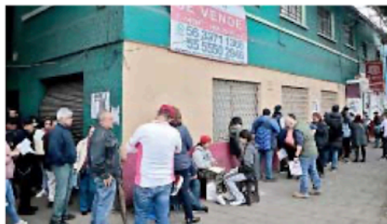
■ Los módulos atienden a quienes reciben ficha el mismo día y a quienes tienen cita previa.

Indicó que se espera la participación de más de 97 millones de mexicanos que elegirán con su voto a quienes ocuparán la Presidencia de la República, gubernaturas, senadurías, diputaciones, presidencias municipales, al-