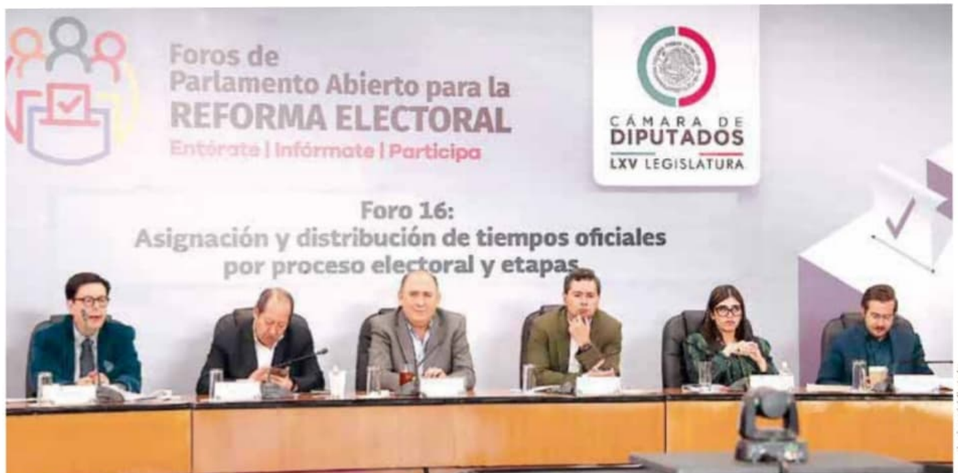
Expertos | Basta de spots.

política es un impuesto que “solamente incluye a la radio y la televisión, no así a otros medios”.