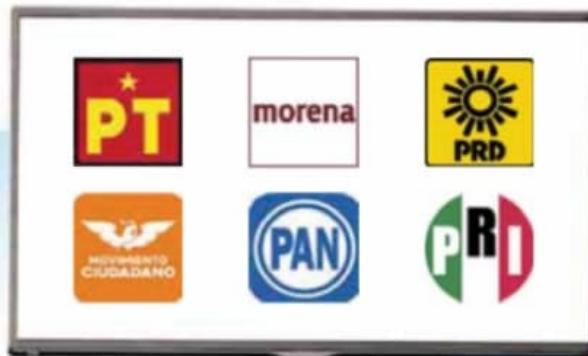
Modelo a debate.

Al referirse al tema que se abordó en el foro 16 el representante de la CIRT comenzó por explicar que el llamado modelo de comunicación