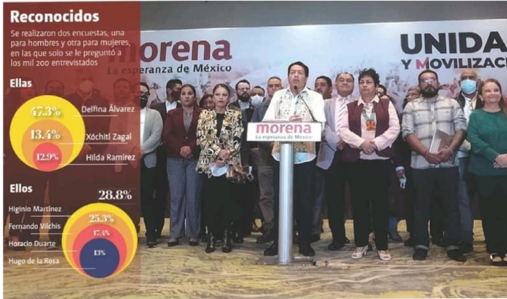
A menos de un año para el proceso electoral, dieron a conocer las preferencias de los simpatizantes. ARIANA PÉREZ