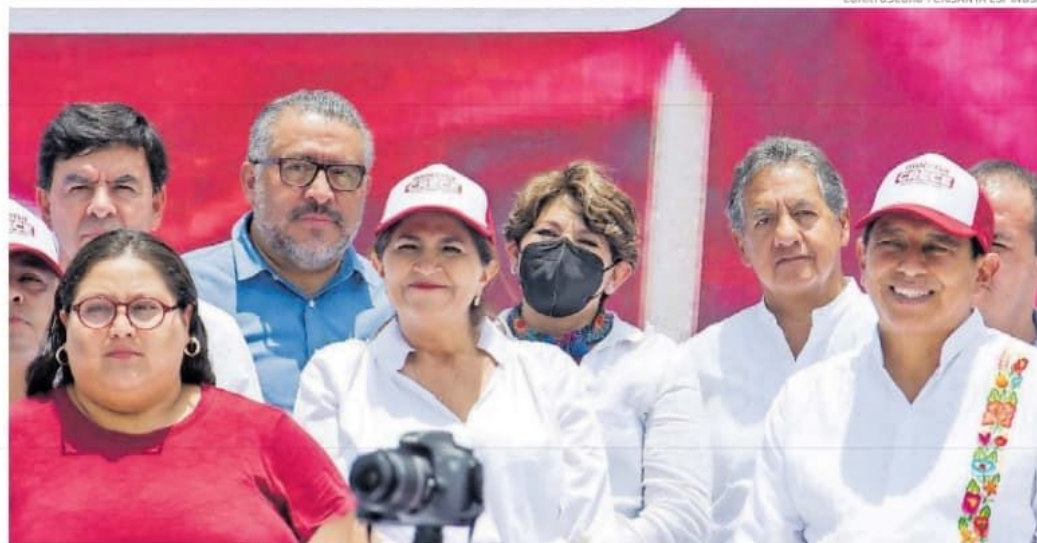
Ambos políticos encabezan la lista de mujeres y hombres que cumplen con el primer requisito para aspirar a la gubernatura estatal.