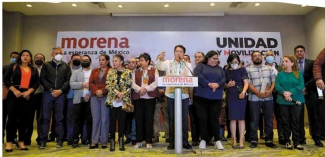
MENSAJE. Mario Delgado, presidente nacional de Morena, ayer, junto a miembros del partido, en conferencia de prensa.

Durante la presentación, el dirigente de Morena, Mario Delgado, aseguró que los resultados de esta primera encuesta —para elegir a