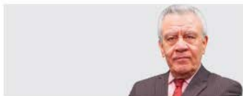
Lic. Mario Delgado, Presidente de Morena:

“E stán preparando la impugnación,” afirmó usted el domingo en Temixco, Puebla, “porque saben que los vamos a derrotar en las urnas. Van argumentar que la violencia, que se metió el presidente, todo lo que antes ellos hacían.”