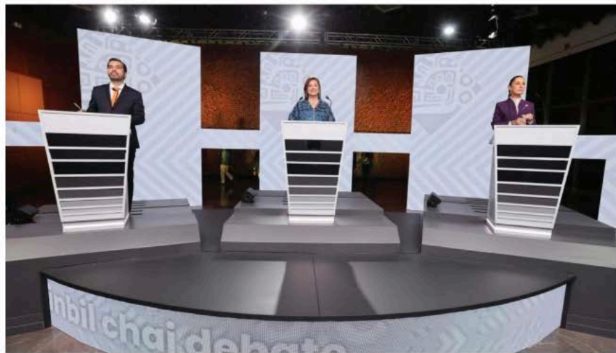
Tercer debate presidencial.

Allí, en una serie de preguntas y respuestas, se vio que hay dos candidatos que