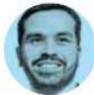
JORGE Á. MÁYNEZ

› En la lógica de Claudia Sheinbaum , la oposición ya no busca ganar las elecciones del 2 de junio. Se conforma y promueven el "voto cruzado" para tratar de dividir y repartir entre los diferentes partidos políticos los más de 20 mil cargos que se disputarán en los comicios. En pocas palabras: quieren parar en seco un eventual carro completo de Morena.