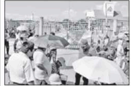
▲ La sección 22 bloqueó instalaciones de Pemex en el municipio de Santa María El Tule, Oaxaca.