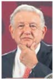
FRANCISCO RODRÍGUEZ EL UNIVERSAL

:::: El domingo, en esta columna le informamos que pese a los apagones que se han registrado en diversas partes del país por el intenso calor, Presidencia de la República había declarado desierta la licitación para el servicio de mantenimiento preventivo y correctivo de sus plantas de emergencia debido a que las empresas interesadas no cumplieron con los requisitos establecidos. Sin embargo, una voz en Palacio Nacional nos reveló —documento en mano— que la licitación se tuvo que declarar desierta pues una de las empresas interesadas había asegurado estar al corriente de sus obligaciones fiscales ante el SAT, pero al ser revisada, se encontró que esto no era cierto. Nos indican que en Presidencia podrían proceder legalmente contra la empresa pues, en el concurso, a la letra se indica que "dicha conducta pudiera ser constitutiva de infracciones a la Ley de Adquisiciones" y pudiera darse vista al Órgano Interno de Control de Presidencia "para los efectos a que haya lugar". Y al final del día sigue sin haber plantas de emergencia.