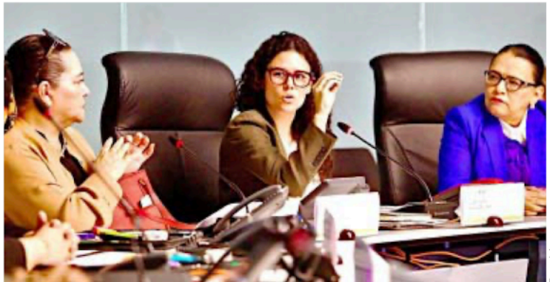
■ La presidenta del INE, Guadalupe Taddei (izq.), la Secretaria de Gobernación, Luisa María Alcalde (centro), y la titular de Seguridad, Rosa Icela Rodríguez (der.), durante una reunión de coordinación para los comicios del 2 de junio.

Ante hechos violentos y la presencia del crimen organizado, ocho estados del País están considerados como focos rojos para los comicios del 2 de junio, por lo que el Gobierno federal desplegará 143 mil 800 elementos en la jornada electoral en esas entidades. Se trata de Chiapas, Guerrero, Tabasco, Sinaloa, Michoacán, Tamaulipas, Sonora y Zacatecas.