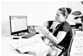
La Codhem apoya en solución de conflictos a través de la mediación.

Se radican entre 10 y 15 asuntos por mes y de ese cúmulo, más del 70% se