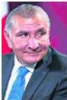
Adán Augusto López

::: Nos comentan que en la lucha por la candidatura presidencial de Morena para 2024, el equipo del secretario de Gobernación, Adán Augusto López , impulsa su nuevo eslogan: "#AhoraesAdanAugusto. En anuncios especta-