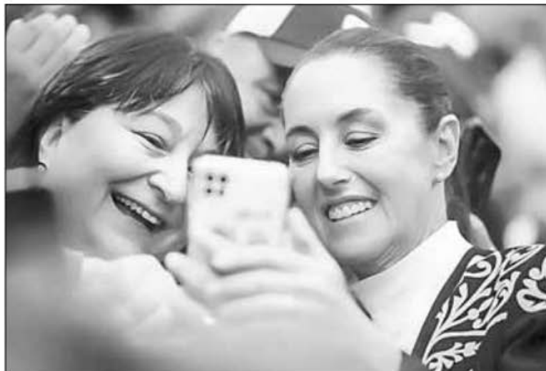
▲ Ataviada con una típica cuera, Claudia Sheinbaum cerró en Nuevo Laredo su visita

por el este de la frontera mexicana para luego trasladarse a Nuevo León.