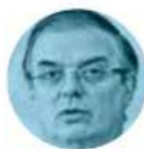
ARMAN MITIN DE APOYO A EBRARD

Muy animado está el gobernador de Oaxaca, Salomón Jara , por la visita del presidente López Obrador y el enviado especial de Washington para el Clima, John Kerry , este martes. El mandatario expuso que le manifestará al de la Casa Blanca su compromiso para mitigar los efectos del cambio climático y destacará las ventajas de la entidad para las inversiones. Sobre todo, para que el territorio se sume al nearshoring para convertirlo en punta de lanza en el sur.