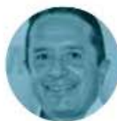
LO RECIBEN EN CANADÁ

Una semana antes de terminar su periodo en el INE, su actual presidente Lorenzo Córdova , realiza una gira a Washington y New York. Del 20 al 24 de marzo, el consejero electoral se reunirá con personalidades como Luis Almagro , secretario general de la OEA, y el subsecretario de Estado para Asuntos del Hemisferio Occidental, Brian Nichols .