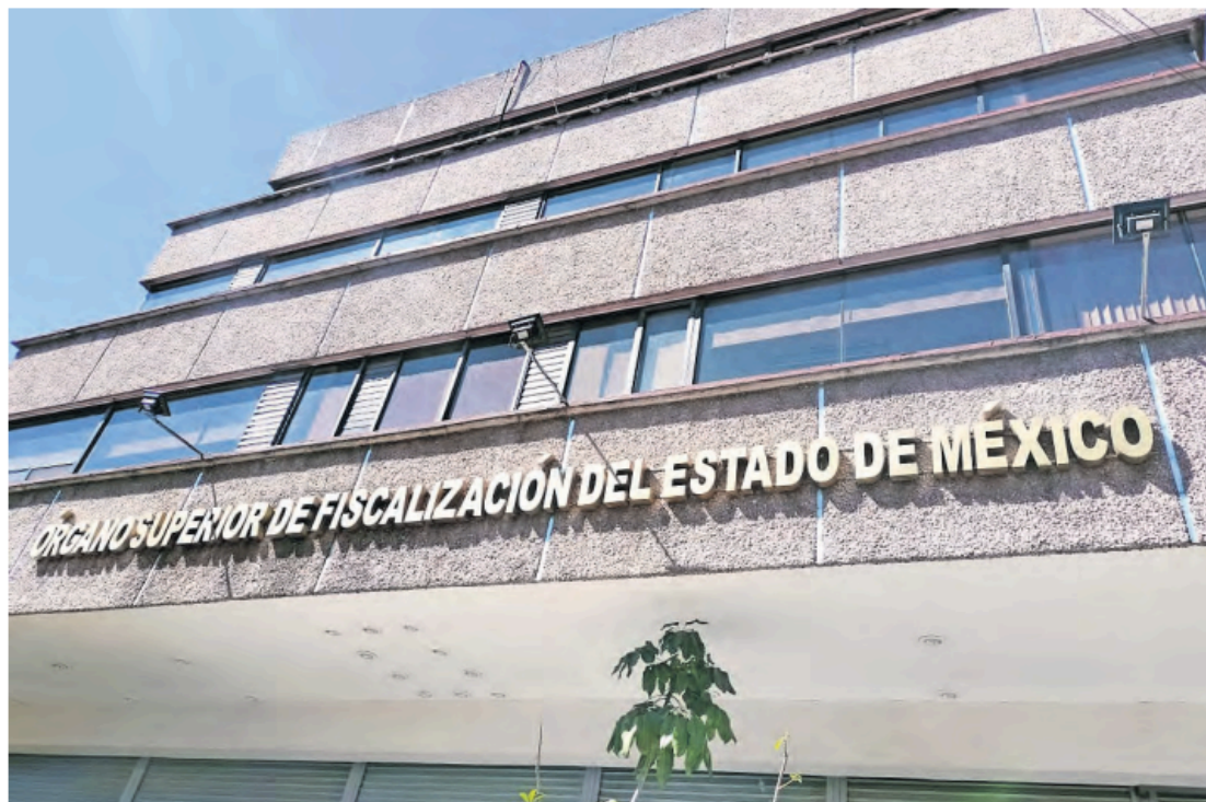
ALMA RODRÍGUEZ, EL UNIVERSAL

De las 378 revisiones que hizo el Órgano Superior de Fiscalización a Cuentas Públicas en 2024, 78 de ellas fueron estatales y 300 municipales.