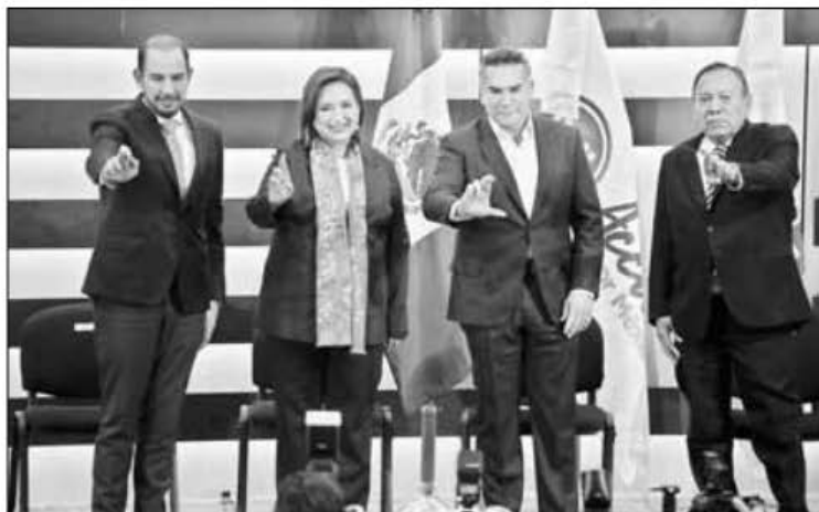
▲ Xóchitl Gálvez acudió ayer a registrarse ante el INE como candidata presidencial de Fuerza y