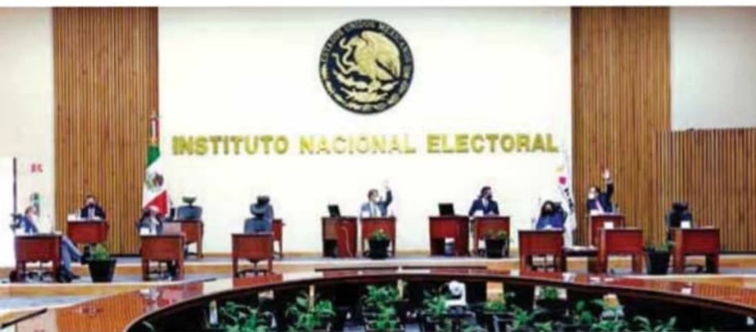
Necesario, generar ahorros.

“Recursos que en la práctica no se utilizaron”.