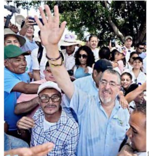
Esta campaña es un humilde recordatorio no de lo que un político puede decir, sino de lo que un pueblo le puede confiar”.