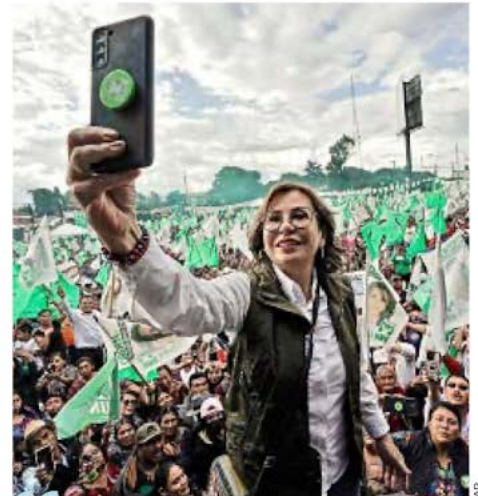
Ya no más papá gobierno, ahora Guatemala va a tener mamá gobierno”.