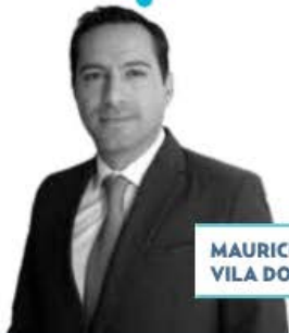
MAURICIO VILA DOSAL