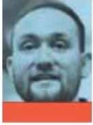
TEMÍSTOCLES VILLANUEVA RAMOS DIPUTADO DE MORENA EN EL CONGRESO CDMX @TEMISTOCLESVR