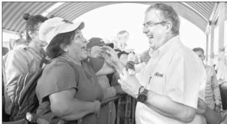
▲ Marcelo Ebrard estuvo ayer en la ciudad de Querétaro, donde insistió en debatir su plan de seguridad con los aspirantes a coordinar la defensa de la 4T.