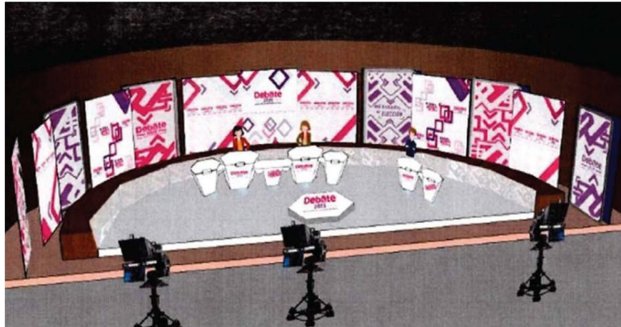
Adaptaron un escenario en el Consejo General del IEEM.

No podrán ingresar con aparatos electrónicos, ni intervenir o hacer expresiones a favor