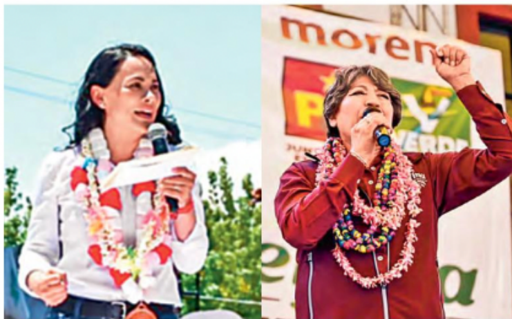
CITA. Las candidatas a la gubernatura del Estado de México expondrán frente a frente sus propuestas.

el pueblo, decir frases chuscas es una táctica para volverse cercano, pero "la mercadotecnia política no tiene que ver con una persona que sea igual, sino con el hecho de que una persona se identifique con esos iguales".