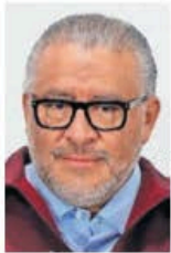
ARTURO HERNÁNDEZ EL UNIVERSAL

Las recientes manifestaciones de los estudiantes de la Escuela Normal Rural Lázaro Cárdenas del Río de Tenería, en Toluca,