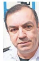
ALEJANDRO VARGAS EL UNIVERSAL

La detección de una nueva modalidad de narcomenudeo en Toluca, donde se ofertan gomitas con sustancias ilícitas o con sabor a bebidas alcohólicas, representa una alerta urgente para las autoridades y