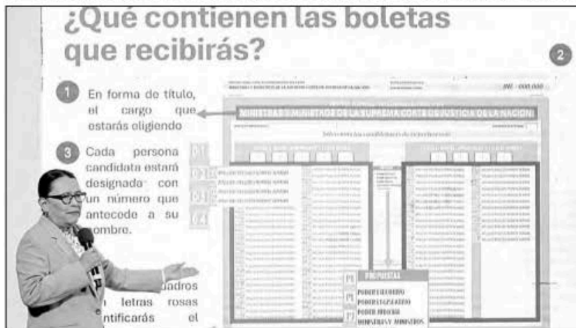
▲ La secretaria de Gobernación, Rosa Icela Rodríguez, explicó ayer en la mañana el contenido de las boletas para la elección judicial de junio. Dijo que el gobierno federal