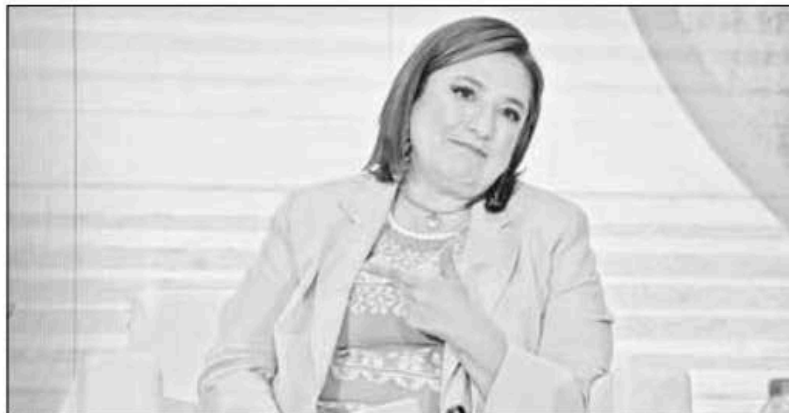
▲ La candidata de Fuerza y Corazón por México, Xóchitl Gálvez, durante su

Twitter: @cafevega cfvmexico_sa@hotmail.com