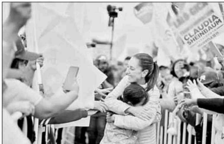
▲ Claudia Sheinbaum abrió ayer su cuarta semana de campaña visitando los municipios

Facebook, Twitter: galvanochoa Correo: galvanochoa@gmail.com