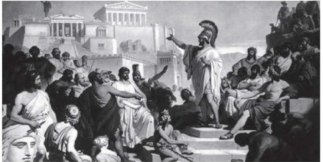
La democracia en la Antigua Grecia era justa.

Fue Clístenes quien llevó las reformas de Solón a otro nivel. Promulgó una reforma electoral que reforzó la igualdad de los ciudadanos ante la ley; estableció la fi-