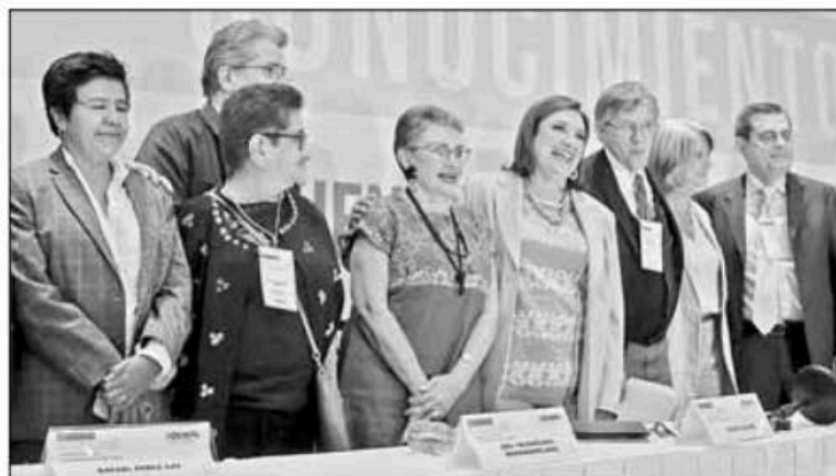
▲ La candidata presidencial de la oposición solicitó a empresarios convencer a sus empleados de votar por ella. La imagen,