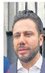
CLAUDIA GONZÁLEZ EL UNIVERSAL

:::: Nos detallan que tras la primera reunión de la mesa política en el Estado de México para revisar el ambiente electoral de cara al 2 de junio, las au-