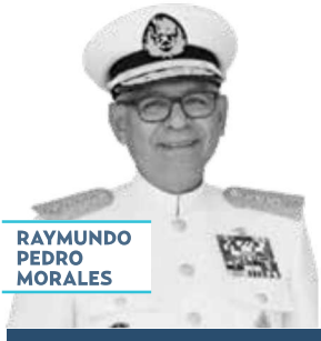
RAYMUNDO PEDRO MORALES

› Interesa a EU y Europa la estrategia del gobierno mexicano para rastrear precursores de fentanilo. El secretario de Marina, Raymundo Pedro Morales , indicó que se han recibido solicitudes para que nuestro país les comparta el método, y así replicarlo. “Lo tenemos nada más nosotros, lo hemos platicado con otros gobiernos; por ejemplo, Inglaterra está interesado en compartir experiencia y Estados Unidos nos está buscando porque ellos no tienen esa trazabilidad”, dijo el almirante.