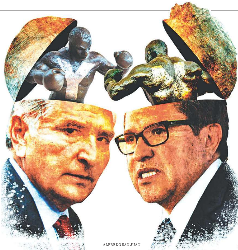
ALFREDO SAN JUAN

Que el senador Yunes es una figura que daña la imagen de Morena está fuera de duda. Pertenece a una familia originalmente de militancia priista de Veracruz, a la que la necesidad política llevó a migrar de un partido a otro, pero que hasta hace algunos meses se había caracterizado por su antipopobradorismo. Todavía en septiembre del año pasado varios de sus miembros cargaban con procesos penales o averiguaciones por escándalos previos, mismos que casualmente desaparecieron, tras la determinación del senador panista de otorgar el voto decisivo que permitió a Morena la aprobación constitucional de la reforma judicial. Todo indicaba que la aparente negociación había quedado saldada con la solución de sus problemas judiciales, pero su reciente designación como presidente de la Comisión de Hacienda del Senado, tomó por sorpresa a muchos y provocó indignación en las filas del movimiento. Una cosa era una negociación forzada para obtener un voto de desempate hace cinco meses y otra distinta encumbrar a un ex rival con imagen de impenetrable y convertirlo en dirigente y operador político de primer orden. Su acreditación como miembro