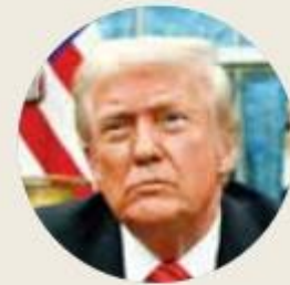
● Donald John Trump

México, justo en este momento. El anuncio pone, además, al gobierno de la presidenta Sheinbaum ante dos nuevas disyuntivas desquiciantes pautadas por Washington: aceptar esa categorización criminal o no, cooperar en ello con los propósitos estadounidenses o no. En esa intemperie se registraron también las palabras que Trump le dedicó a la presidenta Sheinbaum . Mujer muy maravillosa, la llamó a propósito de una conversación sobre consumo de fentanilo ese hombre poco dado a elogios de tal calidez: "He estado hablando con la Presidenta de México, hago tantas llamadas y nunca aprendo tanto de nadie; lo sé todo y nunca aprendo nada de nadie; muchas gracias a la Presidenta de México". Golpazos y rosas. Dos hechos, un mismo día. Trump , todo es Trump .