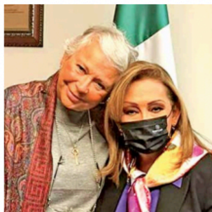
El gobernador de Oaxaca, Salomón Jara, se reunió con Ricardo Monreal, mientras Lorena Cuéllar, de Tlaxcala, con Olga Sánchez.