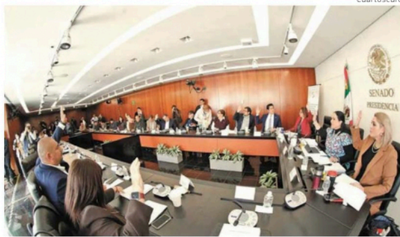
Comisiones unidas de Gobernación y de Estudios Legislativos del Senado sesionan hoy.

Las comisiones unidas de Gobernación y de Estudios Legislativos, Segunda del Senado, proponen rechazar cambios al Plan B aprobado en diciembre en la Cámara de Diputados, con lo cual se mantendrían la "cláusula de vida eterna" que permite transferir votos a los partidos que no hayan logrado el 3% de la votación en elecciones federales a fin de mantener su registro.