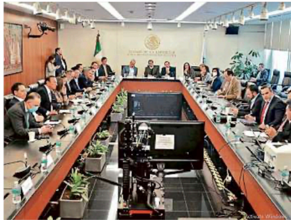
El pasado 9 de febrero, personal del INE expuso ante senadores los riesgos de aprobar el "Plan B" electoral.

En el dictamen no se da por muerta la cláusula que establece que los partidos políticos podrían postular candidatos bajo la figura de candidatura común y para ello celebrar un convenio de distribución de los votos emitidos lo que significa una transferencia artificial de sufragios para garantizar la so-