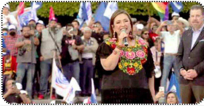
Xóchitl Gálvez Ruiz

“NO PODEMOS RETROCEDER, INE es necesario para México”