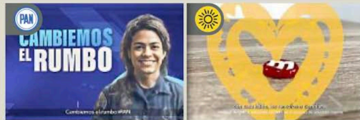
PAN y PRD optaron por anuncios en los que llaman a simpatizantes a "cambiar de rumbo".