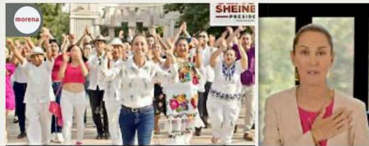
En los spots de precampaña de Morena aparece Sheinbaum; pide "no regresar al pasado".

Imágenes de algunos de los promocionales que lanzarán los partidos políticos a partir de lunes en medios electrónicos.