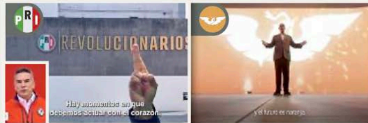
Líderes de PRI y MC aprovecharon los promocionales para dar mensajes en primer plano.