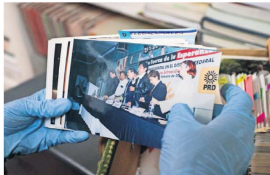
En los trabajos de conformación del archivo también se encontraron fotografías, pero no todas fueron catalogadas.

CRISTOPHER CABELLO —adonai.cabello@clabsa.com.mx