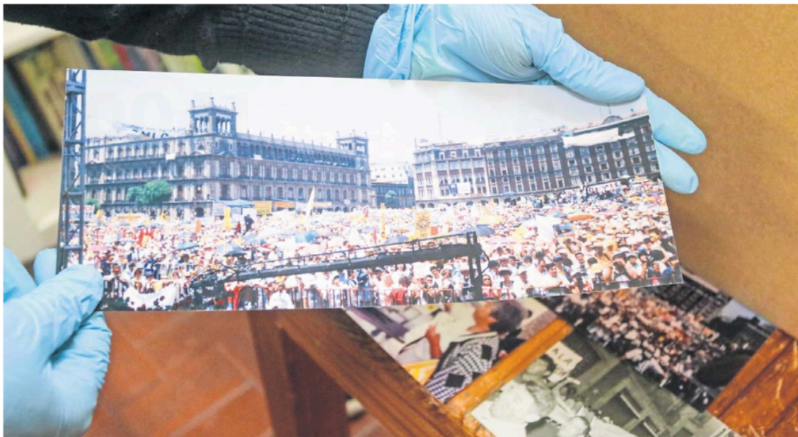
Fotografía de un mitín del partido en el 2000, año en que el PRD tomó aún mayor fuerza en la Ciudad de México.

Al perder su registro, el partido ha tenido que desprenderse de este acervo que resguarda parte de la historia reciente de la izquierda política mexicana