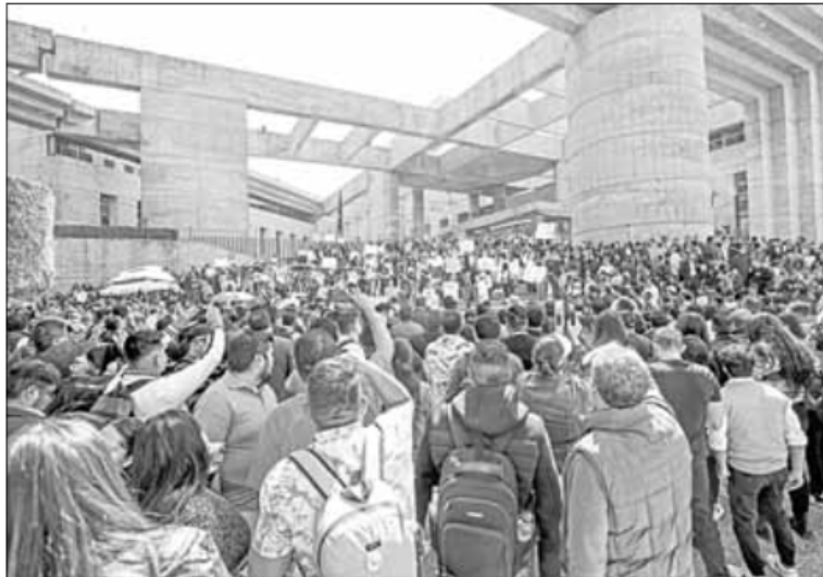
▲ Trabajadores del Poder Judicial de la Federación protestaron por tercer día consecutivo en la sede de San Lázaro para

Y, MIENTRAS ESTE domingo, de una a tres de la tarde, se realiza un programa especial de Astillero Informa en el foro Salvador Allende de la Feria Internacional del Libro del Zócalo (se transmitirá por Youtube, Facebook y Twitter: Astillero Informa), ¡hasta mañana!