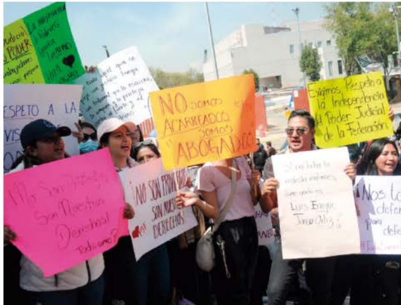
SINDICALIZADOS DEL PJ se manifestaron a las afueras de la Cámara de Diputados, ayer.

Hay tres fideicomisos relacionados con pensiones complementarias, es decir, montos de pensión que se suman a los que asigna por ley el Instituto de Seguridad y Servicios Sociales de los Trabajadores del Estado (ISSSTE) a funcionarios públicos.