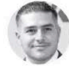
OMAR GARCÍA HARFUCH

› Le cayó de perlas al padre Alejandro Solalinde el anuncio de la incorporación de Alejandro Encinas al equipo de Claudia Sheinbaum . El activista se la pasó grillando al aún subsecretario de la Segob, y ya estaría cabildeando para que uno de sus cercanos se quede con el cargo que, por cierto, se ocupa de los temas migratorios.