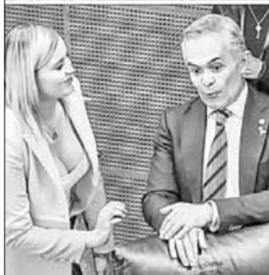
▲ El senador del Partido de la Revolución Democrática y ex jefe de gobierno capitalino, Miguel Ángel Mancera, estuvo acompañado durante la sesión plenaria de ayer en la Cámara alta.