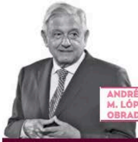
ANDRÉS M. LÓPEZ OBRADOR

› Para dar el ejemplo, el presidente López Obrador se aplicará alguna de las vacunas contra el Covid-19 avaladas por la Co-fepris: la cubana Abdalá o la rusa Sputnik. La próxima semana, probablemente el martes, recibirá la dosis. De hecho, será doble vacunación, pues aprovechará para que le suministren la de la influenza estacional. “Aquí (en la mañanera) me van a jeringar para que todos vayan a vacunarse, a protegerse”, dijo.