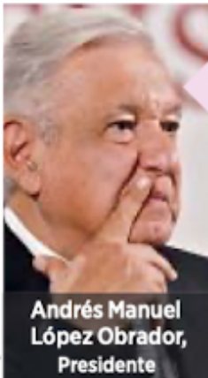
Andrés Manuel López Obrador, Presidente

“Defenderemos el presupuesto (...) Ese valor que esperamos cada vez que un proceso inicia y termina: la garantía de que todo tiene la certeza adecuada y que está en el marco de la ley. No es costo, tiene valor la democracia”.