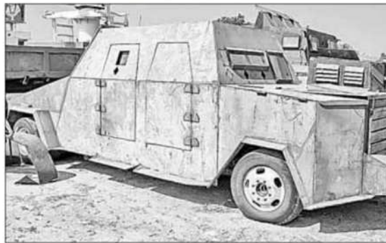
▲ La destrucción de 14 vehículos con blindaje artesanal cumplió con las normas oficiales, indicó en Tamaulipas la Fiscalía General de la República.

Y, MIENTRAS EL presidente López Obrador alista para septiembre una visita a Chile, en el contexto del medio siglo del golpe pinochetista que terminó con la vida de Salvador Allende y con el proyecto socialista que encabezaba; gira al sur que incluirá a Argentina, Brasil y Colombia, donde hay gobiernos progresistas, ¡hasta mañana!