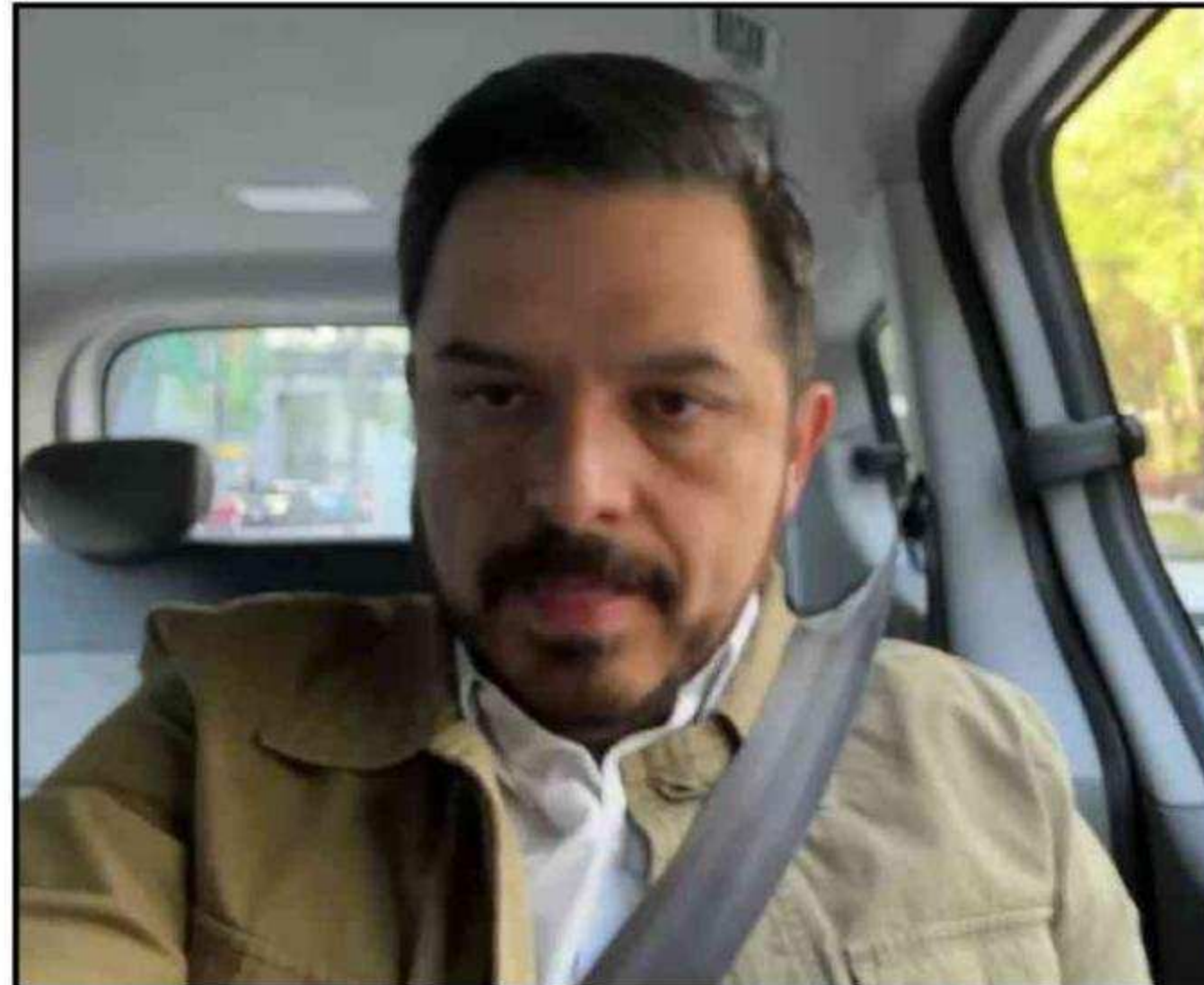
Zoé Robledo Aburto

Otro es Zoé Robledo , todavía director gene-