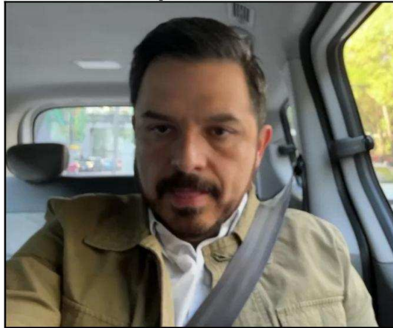
Zoé Robledo Aburto