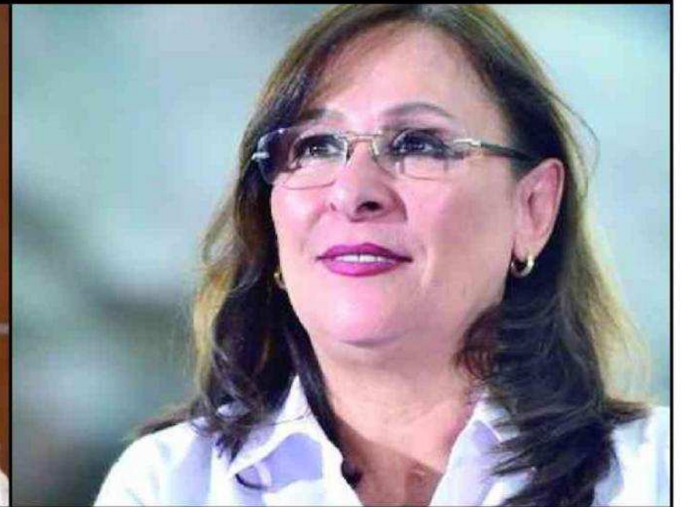
Rocío Nahle García

ral del IMSS, quien buscará la candidatura por la gubernatura de Chiapas; o Javier May , director del Fondo Nacional de Fomento al Turismo (Fonatur) , quien busca ser gobernador de Tabasco .