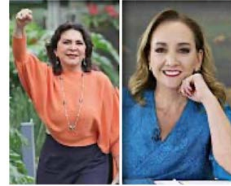
■ Patricia Mercado, Paola Longoria, Ivonne Ortega y Claudia Ruiz Massieu van por MC.