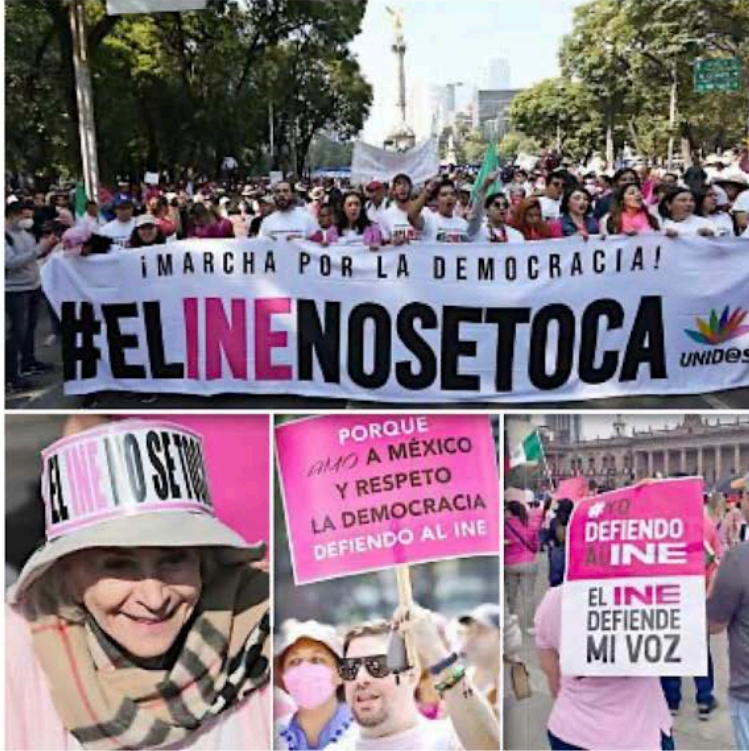
Las movilizaciones en favor de la autonomía del INE han sido la columna vertebral de la “Marea Rosa”

Muestra del miedo, agrega, es su inconformidad de