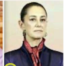
3 Claudia Sheinbaum