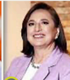
2 Xóchitl Gálvez