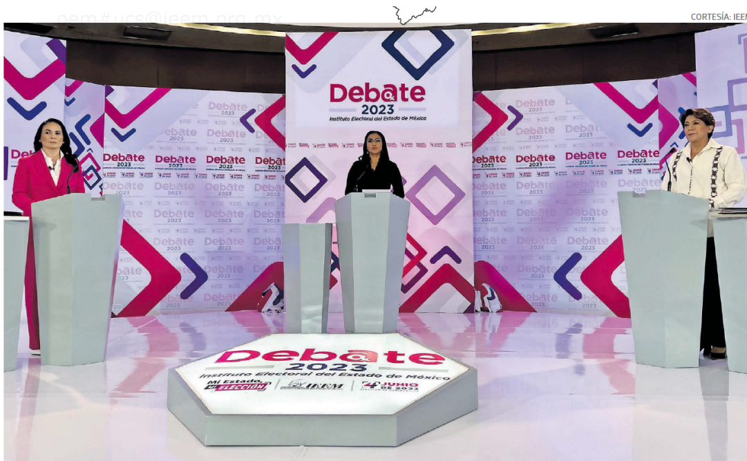
Ambas candidatas mantuvieron la estrategia de sus giras de campaña y reiteraron las ofertas políticas