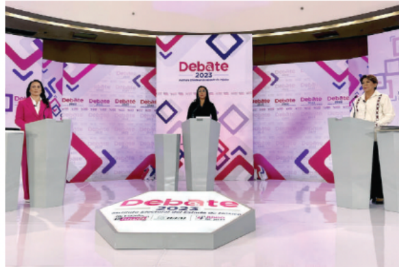
LAS CONTENDIENTES por la gubernatura del Edomex durante el debate, ayer.