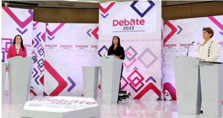
Delfina Gómez y Alejandra del Moral, en el segundo debate.

Delfina Gómez, mostró la fotografía de una boleta, e indicó que votó por PRI, PAN, PRD y NA es votar por la corrupción, pidió a la gente no dejarse engañar y