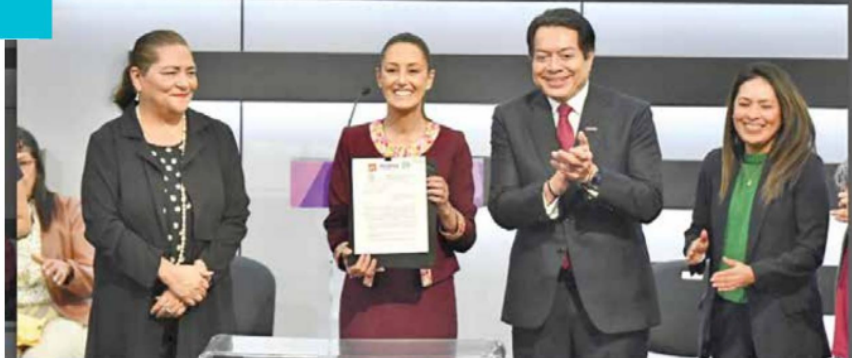
DEFENSA | • La candidata presidencial pidió construir un México más justo e igualitario.