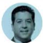
FRANCISCO G. CABEZA DE VACA