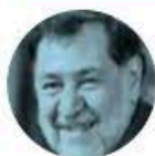
GERARDO FERNÁNDEZ NOROÑA

» Es “tema cerrado” el diferendo entre los coordinadores de Morena en la Cámara de Diputados, Ricardo Monreal , y en el Senado, Adán Augusto López , dijo el presidente de San Lázaro, Sergio Gutiérrez Luna . El legislador incluso consideró que “no hay más que aclarar” sobre la supuesta reducción en el presupuesto de la Cámara Alta, motivo de la disputa entre el tabasqueño y el zacatecano. Por su parte, la lideresa morenista, Luisa María Alcalde , llamó a presentar denuncias.