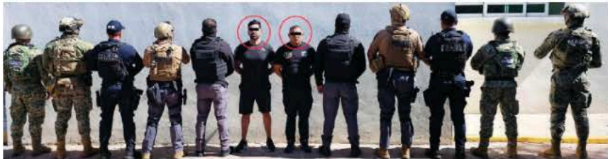
FUNCIONARIOS municipales detenidos el 22 de noviembre como parte del Operativo Enjambre.

Las fuerzas de seguridad, luego de la denuncia, terminaron deteniendo a El Rey y su pareja Eulalia, luego de un operativo en el que ubicaron el rancho en donde estuvo secuestrada la presidenta municipal. En el lugar encontraron ropas de camuflaje con la leyenda Fuerzas FM, dos vehículos, un arma de fuego, más de 100 cartuchos útiles, un chaleco táctico y equipos de radio comunicación.