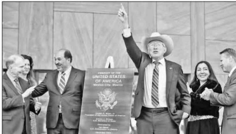
▲ Lázaro Cárdenas Batel, jefe de la Oficina de Presidencia, acompañó ayer al diplomático