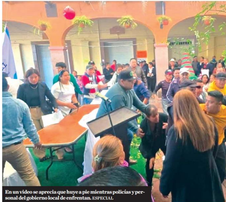
En un video se aprecia que huye a pie mientras policías y personal del gobierno local se enfrentan.

En ese momento, personal del gobierno municipal intentó ayudar al alcalde electo y, entre jaloneos y empujones, logró escapar. En un video se aprecia cómo el hombre, quien viste playera amarilla, huye a pie, mientras los Policías de Investigación y trabajadores del gobierno local se enfrentan. "Todo fue extraño por-