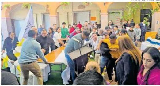
La situación del alcalde podría devengar en que estime funciones su suplente