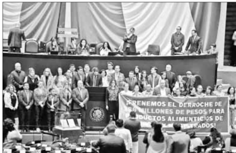
▲ El pleno de la Cámara de Diputados aprobó en lo general la desaparición de fideicomisos

Y, MIENTRAS SE ha sentenciado a 90 años de cárcel a cinco militares responsables del asesinato de dos estudiantes del Tec de Monterrey 13 años atrás, en pleno calderonato, crimen que el propio Calderón y otros mandos militares y civiles pretendieron dejar impune, ¡hasta mañana!