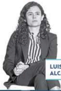
LUISA MARÍA ALCALDE

► Gran festejo por el 70 aniversario del voto femenino realizaron las mujeres de la 4T. El evento, en el Centro Cultural Los Pinos, lo encabezó la secretaria de Gobernación, Luisa María Alcalde , y reunió a funcionarias, mandatarías y legisladoras. Se destacó el caso de Quintana Roo, gobernado por Mara Lezama , donde 64% de los cargos de elección popular son ocupados por mujeres, siendo el estado del país en el que tienen mayor representación.