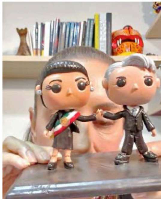
■ “Aquí está AMLO que me está poniendo la banda”, posteó Claudia, y dijo que quitará los muñecos para evitar sanciones.