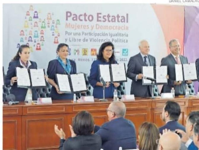
Se firmó el pacto "Mujeres y Democracia por una Participación Igualitaria".

Frente al proceso electoral del próximo año, se asume el compromiso de promover el principio de paridad durante todo el periodo de gobierno.