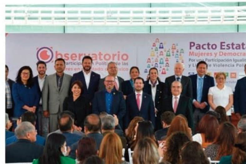
Firman el Pacto Estatal Mujeres y Democracia.

xico (PVEM), el coordinador estatal de Movimiento Ciudadano y el integrante de la Comisión Ejecutiva Estatal del Partido del Trabajo (PT) en el Estado de México.