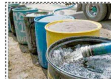
Asignatura: Continuidad y viabilidad hidrica CdMx