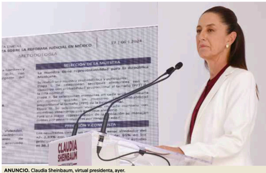
ANUNCIO. Claudia Sheinbaum, virtual presidenta, ayer.

“Nosotros ganamos la elección con 59 por ciento. (...) Me parece muy relevante, porque si hubiera sido 59 por ciento, pues es como las personas que votaron por nosotros, pero es todavía más de las perso-