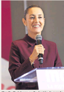
Claudia Sheinbaum recibe bastón de mando en Parque Ecológico de Xochimilco.

● Oaxaca, Oax.— Claudia Sheinbaum no esperó a la fecha oficial fijada por Morena para iniciar recorridos y adelantó sus actividades para hoy en la mañana, donde se reunirá con mujeres de pueblos originarios de Xochimilco en la capital del país.