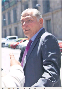
Decidió declinar los 5 millones de pesos que otorga Morena para precampaña.

● En Jalisco, territorio de la oposición que gobierna Movimiento Ciudadano, está lunes Adán Augusto López arrancará su precampaña en la disputa interna de Morena y sus aliados de cara a la encuesta que definirá al candidato presidencial en 2024.