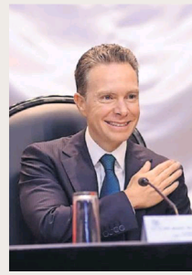
Manuel Velasco se cobja en habitantes de Chiapas, entidad que gobernó.

● Será en Chiapas, entidad que gobernó y considera su bastión político, donde el senador con licencia Manuel Velasco arrancará sus actividades en pos de la nominación de la alianza que su partido, el PVEM, tiene con Morena y el PT para ser el candidato presidencial.