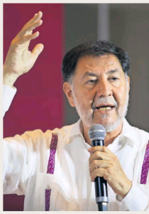
Fernández Noroña estará el lunes en el centro de Oaxaca acompañado de simpatizantes.

● Con una movilización con la que busca representar el espíritu de lucha social que ha caracterizado a su carrera política, Gerardo Fernández Noroña arrancará su gira por el país.