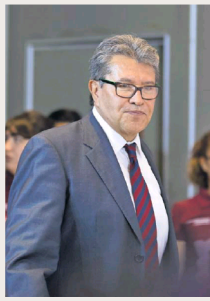
Monreal dará banderazo de salida en la alcaldía Cuauhtémoc y seguirá en Estado de México.

● En la colonia San Rafael, alcaldía Cuauhtémoc, que considera su segunda patria después de Zacatecas, Ricardo Monreal iniciará sus actividades en busca de ser el candidato de Morena a la Presidencia de la República en 2024.