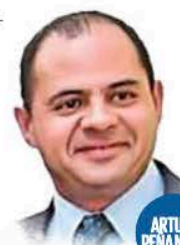
ARTURO PEÑA NIETO