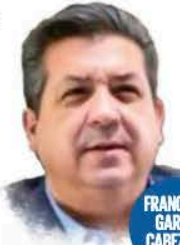
FRANCISCO GARCÍA CABEZA DE VACA

APENAS SE DIO a conocer el proyecto de resolución de la magistrada Janine Otálora, que le retiraba la candidatura plurinominal a Francisco García Cabeza de Vaca, por considerar que aún es prófugo de la justicia, salió a la luz una solicitud de amparo del exgobernador de Tamaulipas contra nuevas investigaciones o posibles órdenes de aprehensión emanadas de diversas autoridades. El exgobernador se ampara contra actos del Poder Judicial de la Federación, de la FGR, del Poder Ejecutivo Federal, de la Fiscalía General de Justicia y el Poder Judicial de la CDMX, de los Poderes y la Fiscalía de Tamaulipas, del Estado de México, de Nuevo León y contra la Procuraduría General de Justicia del Estado de Hidalgo, justo donde despachó por dos años su enemigo declarado, Santiago Nieto Castillo.