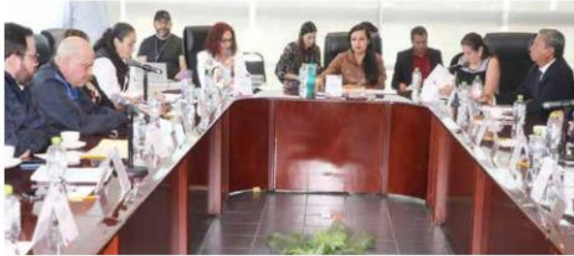
El Instituto Electoral organiza los preparativos para el debate.

De la misma forma, la consejera aseguró que cada candidata podrá asistir con apoyo de material visual si así lo requiere, en tanto que se determinó que el público no podrá acceder con material adicional, ni tampoco