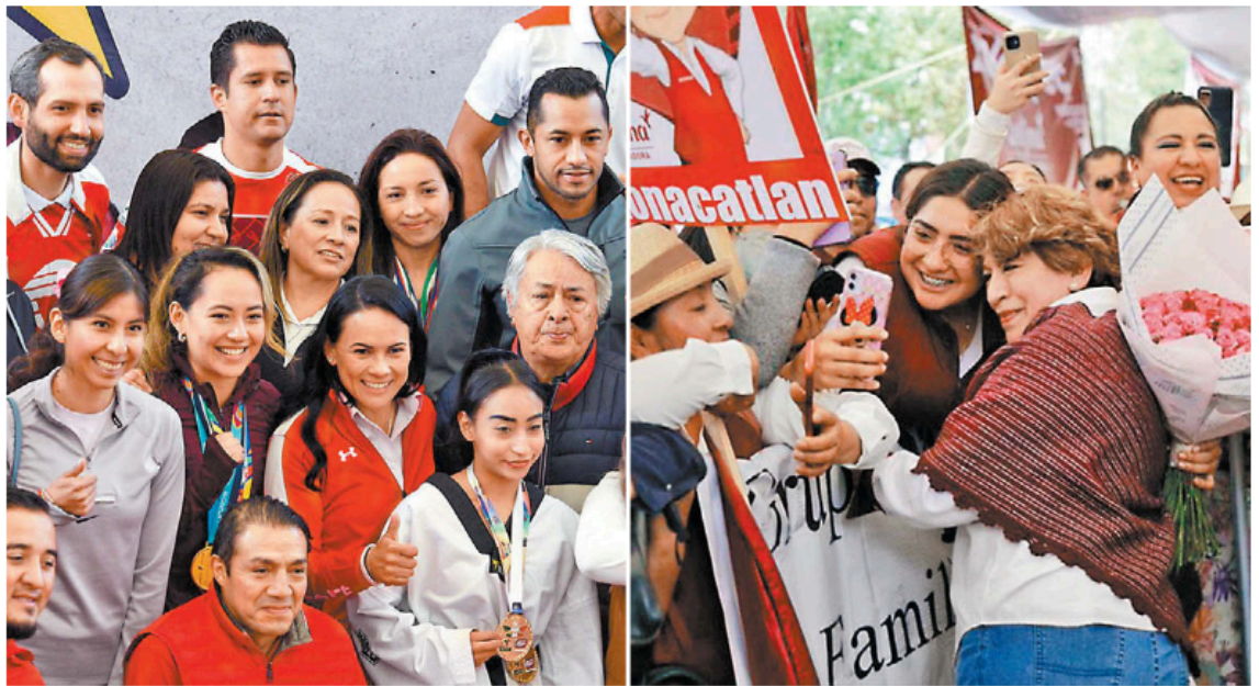
La aliancista estuvo con deportistas mientras que la morenista estuvo en el municipio de Xonacatlán.

En el caso de los temas del combate a la corrupción y violencia de género, tendrán cuestionamientos por parte de los habitantes; mientras que en los tópicos servicios públicos y cultura y recreación serán preguntas por parte de la moderadora, según el formato establecido, indicó el comité.