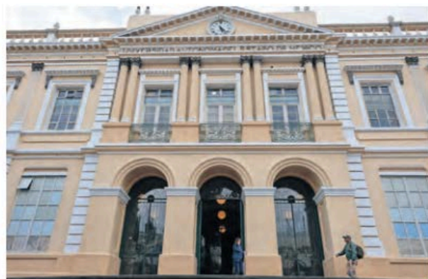
Fachada de la Rectoría de la UAEMéx.

:::: Cuatro de las cinco aspirantes a la Rectoría de la Universidad Autónoma del Estado de México han expresado su inconformidad con la gestión de la campaña en medios, la cual está siendo controlada directamente por la Dirección de Comunicación Universitaria. Consideran que esta situación es inequitativa y favorece a una candidatura en particular, lo que genera dudas sobre la imparcialidad del proceso. Coinciden en que la difusión de información debería garantizar igualdad de condiciones para todas las contendientes, sin sesgos institucionales. Las aspirantes inconformes califican el manejo de la comunicación como sospechoso y poco democrático y argumentan que la administración central está interviniendo de alguna forma en el proceso electoral y esto puede empañar el proceso.