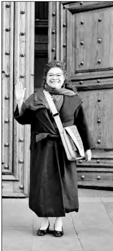
▲ La jefa de Gobierno de la Ciudad de México, Clara Brugada, al salir de la junta del gabinete de seguridad nacional con la presidenta Sheinbaum.