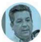
FRANCISCO G. CABEZA DE VACA

› Por cierto, el coordinador de Morena en la Cámara de Diputados, Ricardo Monreal , recibió a Omar García Harfuch , titular de la Secretaría de Seguridad y Protección Ciudadana, para afinar estrategias respecto a las iniciativas enviadas en este sector. Coincidieron en fortalecer la inteligencia, investigación del delito y combate a la impunidad.