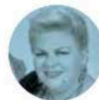
PAQUITA LA DEL BARRIO

› Muy contentos están en el ISSSTE, que dirige Martí Batres Guadarrama , por la realización de las asambleas del programa La Clínica Es Nuestra. Nunca había sido convocada la comunidad para buscar soluciones a las necesidades de sus clínicas. Se trata de un cambio cualitativo que fortalece la apropiación social sobre la institución.