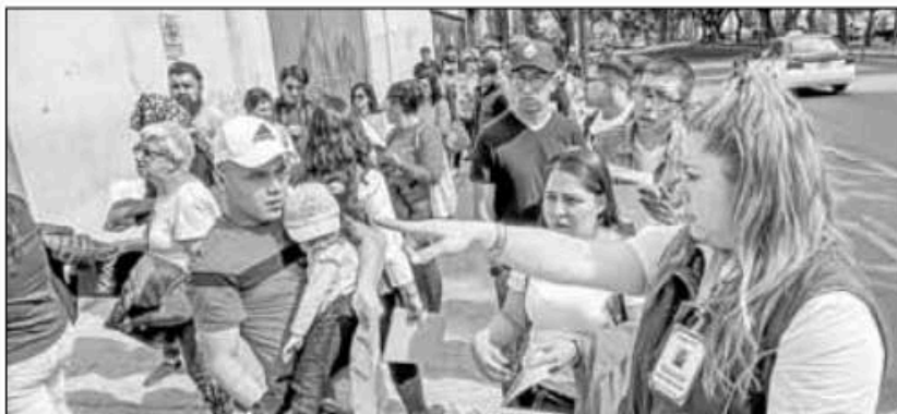
▲ En vísperas de que concluya el plazo para tramitar la credencial para votar por primera vez o solicitar cambio de domicilio, corrección de datos y remplazo por vigencia,